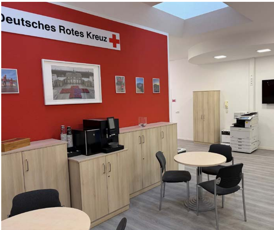
Eingangsbereich der neuen Kreisgeschäftsstelle